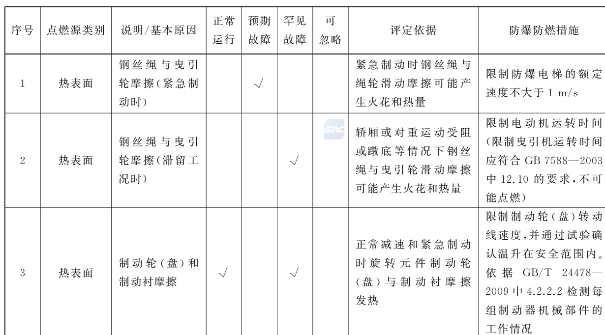
表 A.2 非电气部件热表面危险评定表