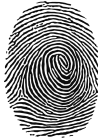
图 A.2 指纹识别装置图形标志